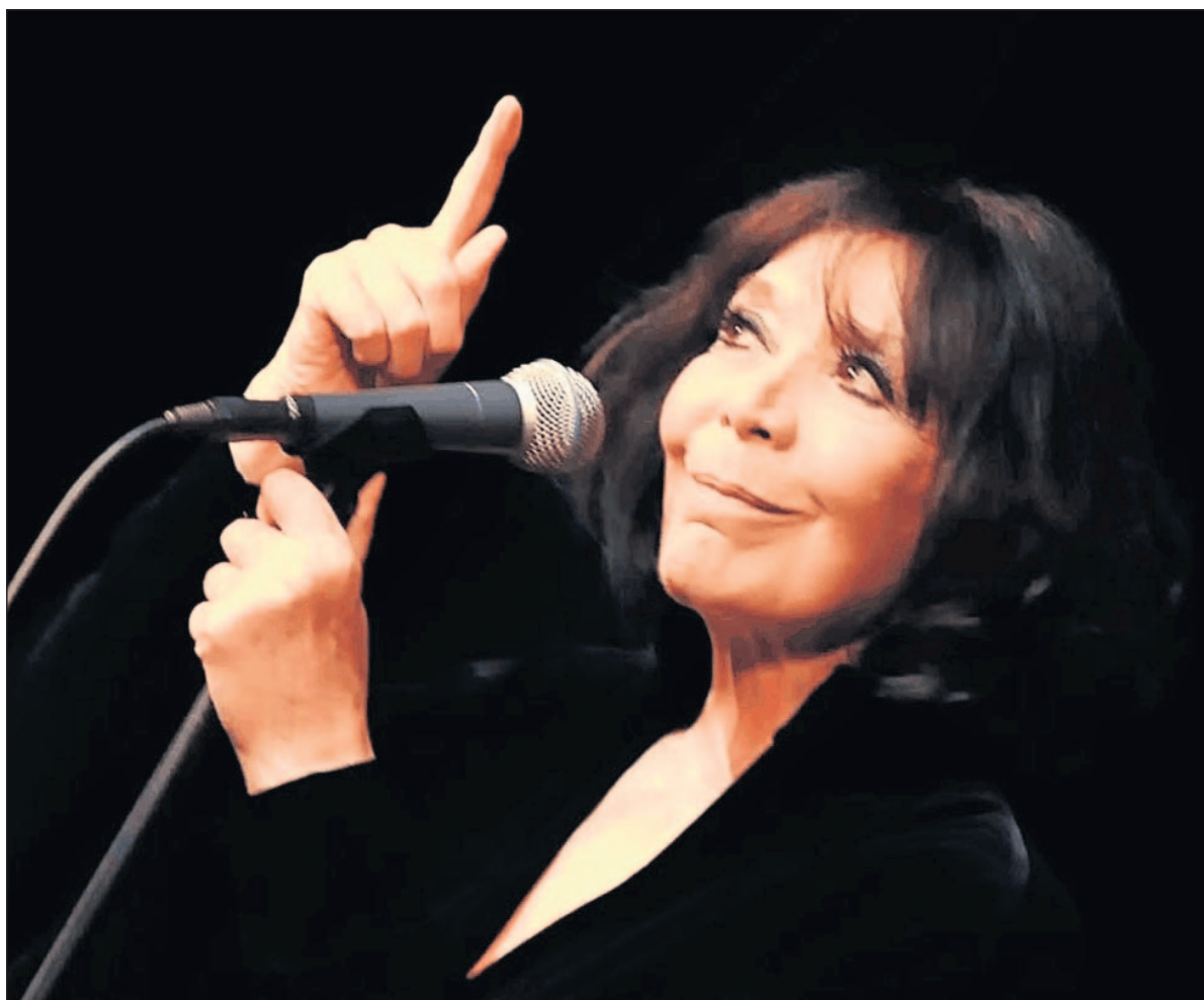
Nimmt mit ihrer Stimme und ihren Gesten das Publikum gefangen: Juliette Gréco.

Juliette Grécos Bühnenpräsenz erfüllt den Raum und die Menschen. Kaum dass man wahrnimmt, von welcher grandiosen Musikern sie da begleitet wird. Demütige Köpfer, gänzlich jenseits aller geschmacklichen Kritikeien. Piano und Akkordeon gehen vollständig in Juliette