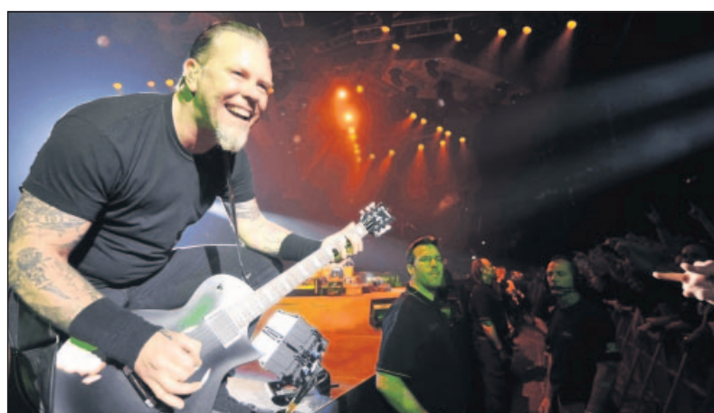
Zum Finale spielt die Band „Metallica“.

Für nur eine Nacht – vier Stunden und 40 Minuten – können Metal-Fans in der ganzen Welt ein Kapitel Musik-Geschichte erleben, wenn die Bands „Metallica“, „Slayer“, „Megadeth“ und „Anthrax“ zusammen auf einer Bühne stehen. Die moderne Satellitentechnik ermöglicht eine Live-Übertragung des Konzertes in ausgewählte Kinos überall auf der Welt. So wird das Konzert in den USA in 450